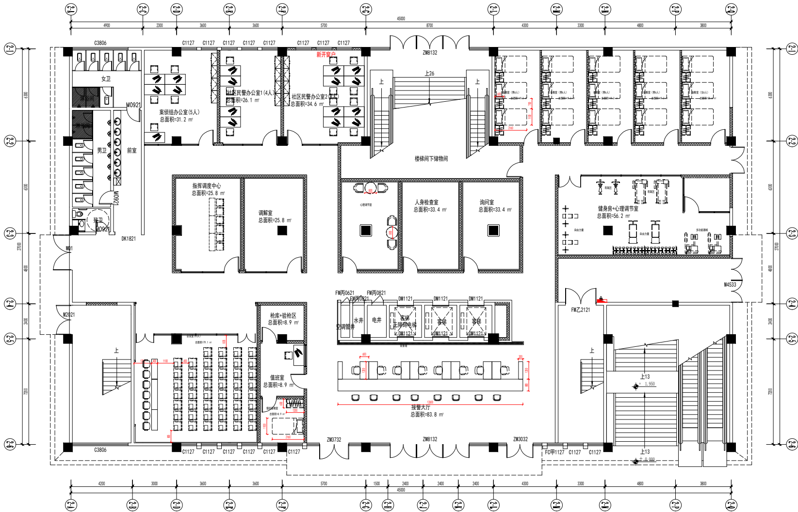
FIXTURE FURNISHING PLAN 2#楼一层平面布置图 SCALE 1:125